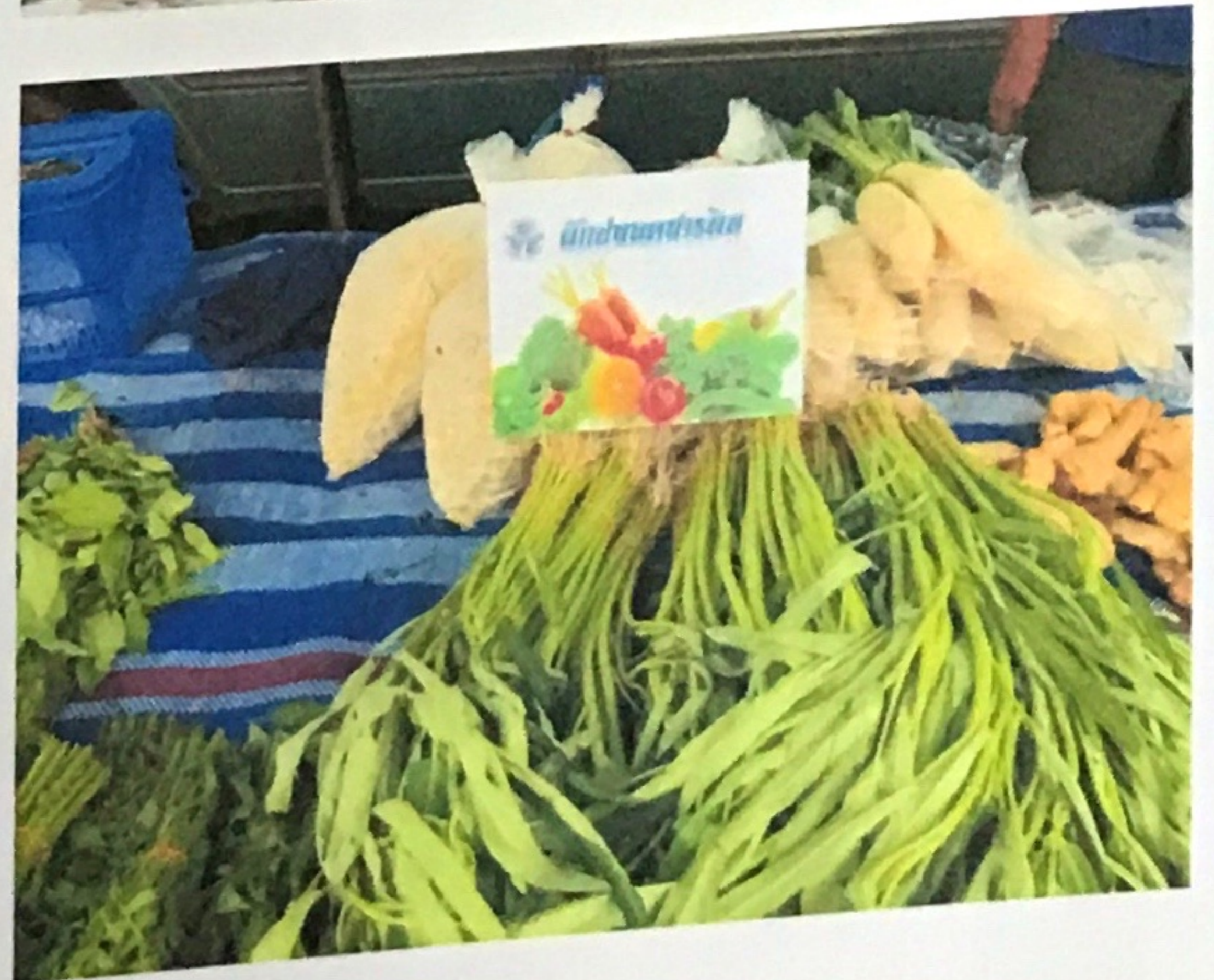
มีร้านค้า แผงค้าที่จำหน่ายอาหาร ผัก ผลไม้ ปลอดภัย มีการรณรงค์ให้ใช้ภาชนะ/บรรจุอาหารที่ใช้วัสดุจากธรรมชาติ/รณรงค์ลดการใช้พลาสติกและโฟม