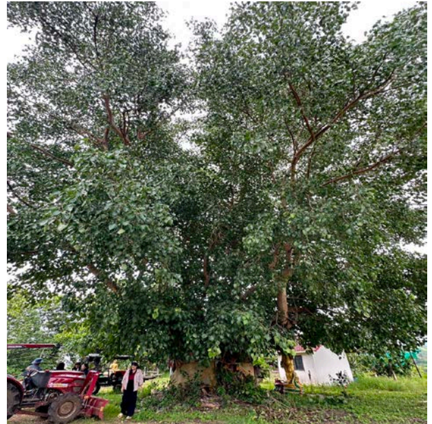
หมู่ที่ ๔ วัดบ้านเฉลียงทอง ชื่อชนิดพืช ต้นโพธิ์ อายุประมาณ ๔๓ ปี จำนวน ๕ ต้น